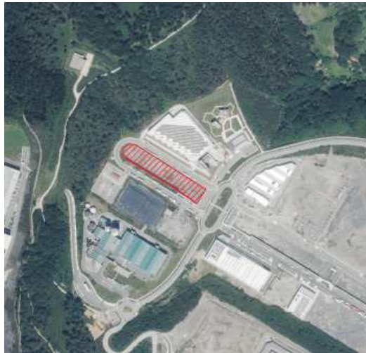
Ilustración 1: Ubicación.

El CPR que se deriva de esta modificación se concreta sobre una parcela de 7.500 m 2 dentro del Polígono Industrial de Eskuzaitzeta, localizado dentro del barrio de Zubieta. El uso principal del CPR será la clasificación del residuo textil y fines comerciales, con una zona de venta de los artículos recuperados. Asimismo, se valora contar con áreas de usos más generales como oficinas, salas polivalentes o zona de restauración.