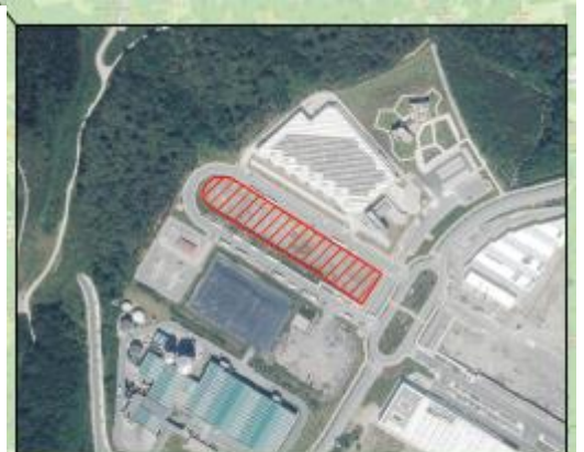
ALTERNATIVA 2: ESKUZAITZETA