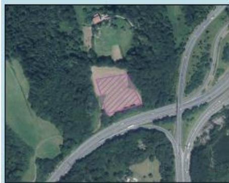
ALTERNATIVA 3: LOISTEGIKOGAINA